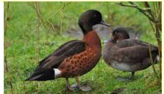
Sarcelle rousse Anas castanea

Faute avouée à moitié pardonnée. Et je tiens à vous écrire la vie de cet oiseau qui est venu me pourrir la vie : il était une fois, en Australie tropicale, une petite sarcelle rousse, non migratrice qui décida de découvrir le monde. Un beau matin, elle claqua la porte de la maison familiale et prit un train pour Sydney puis un avion pour Paris. Métro, RER, puis de la force de ses petites ailes toutes fraîches elle partit découvrir le Gâtinais et un étang de ce terroir.