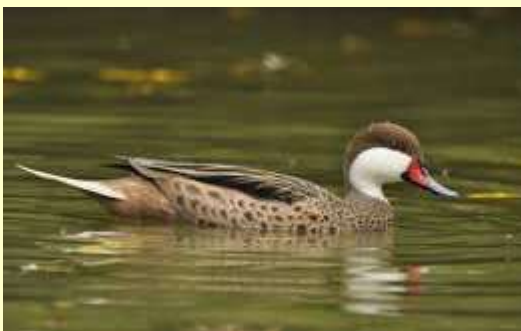
Pilet des Bahamas Anas bahamensis

J'ai failli à notre Président qui m'avait proposé d'écrire un article sur les espèces invasives ! Je ne viens pas de vous parler d'oiseaux EEE ! Tout simplement d'oiseaux d'ornement échappés de captivité. S'ils ne peuvent prétendre au caractère invasif, ils peuvent représenter le quotidien de nos sorties de chasses.