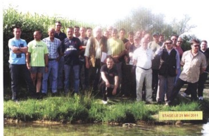
STAGE LE 21 MAI 2011