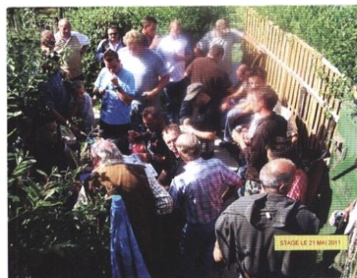
STAGE LE 21 MAI 2011