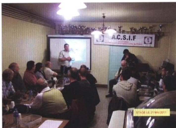
STAGE LE 21 MAI 2011