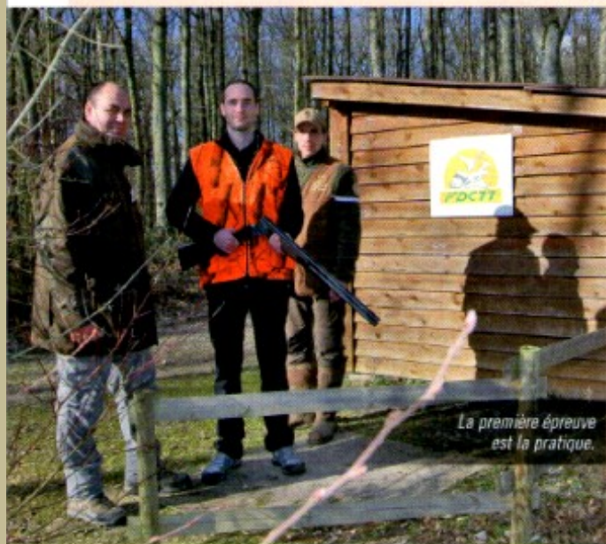
La première épreuve est la pratique.

L'inspecteur dispose d'un ordinateur portable avec un logiciel spécifique. Il supervise l'utilisation du poste informatique – PC ou tablette – par le candidat. Une connexion internet n'est pas nécessaire.